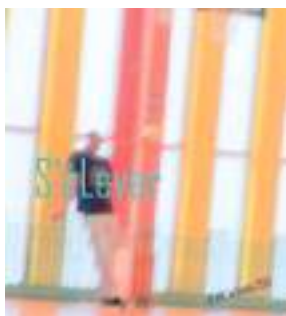
CD de Slam « S'ELever »