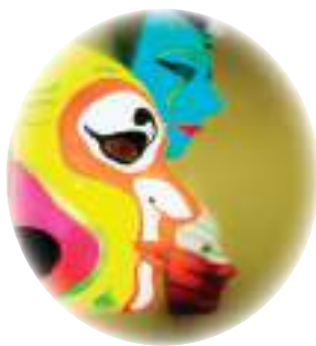
Création de masques